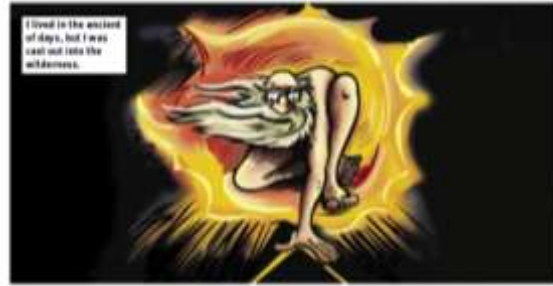
'Ancient days' door Robert Blake 1794

Hij is in de 'hemel' wanneer hij onder invloed is, maar in de 'hel' wanneer de pijnlijke dagelijkse realiteit weer voelbaar is. Het verhaal gaat verder en laat 'God' zien terwijl hij drugs spuit. De tekst geeft hierbij advies over veiliger gebruik.